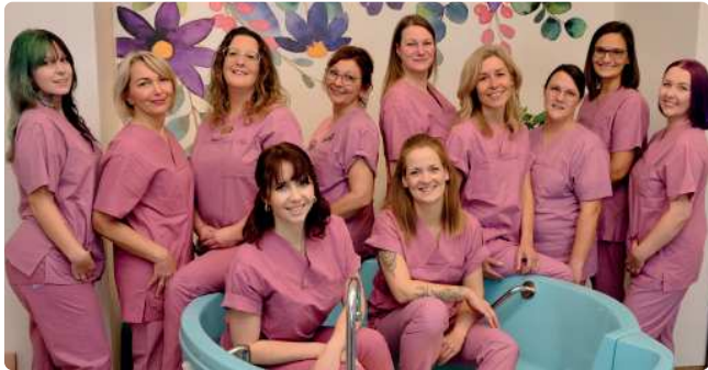
Ihr Team der Geburtshilfe

Als Ergänzung zur Geburt im interprofessionellen Kreißsaal können Schwangere mit einem unauffälligen Schwangerschaftsverlauf ihr Kind in unserem Hebammenkreißsaal gebären.